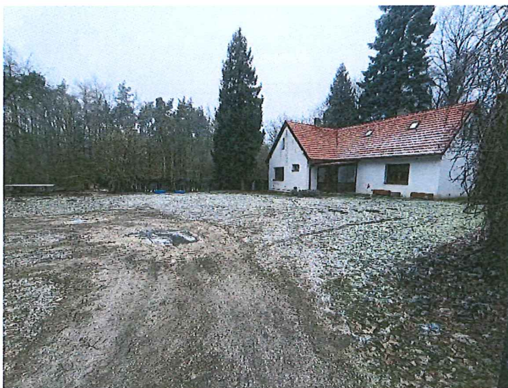
Ad 2. Zdjęcia nieruchomości w Czołowo 24: